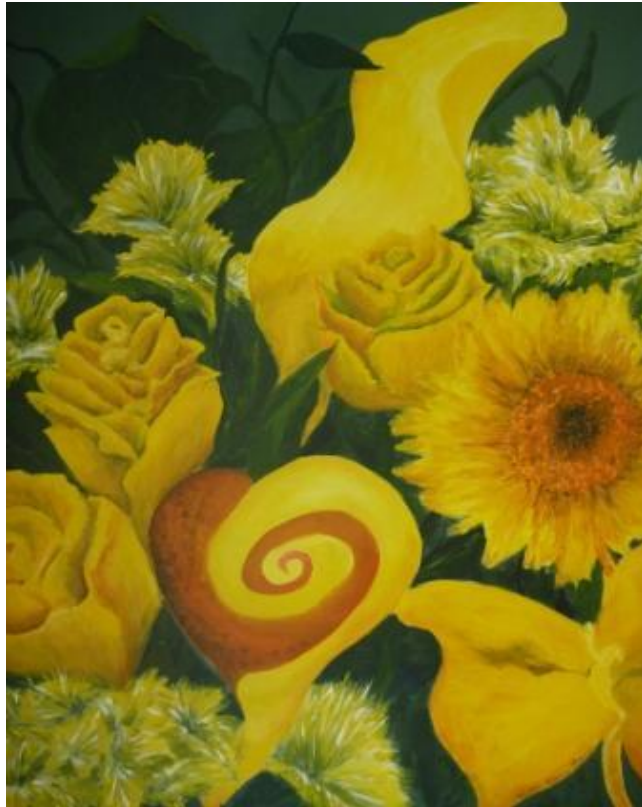
„Gelbe Blüten“, 2016 Acryl auf Leinwand 60x80 cm