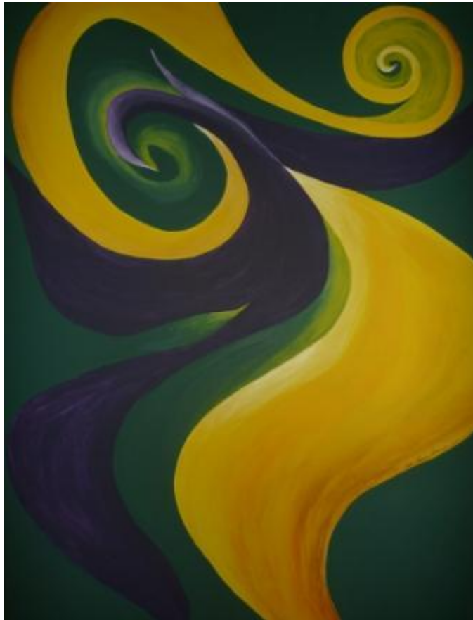
„Violette Rhododendron abstrakt“, 2017