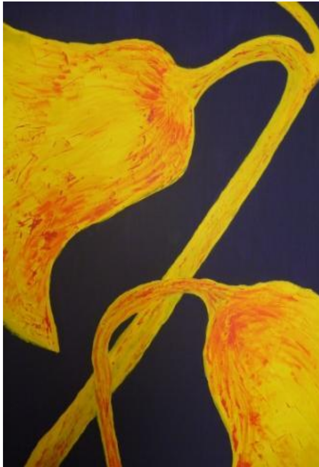
„Glocken“, 2017 Acryl auf Leinwand 90x150 cm