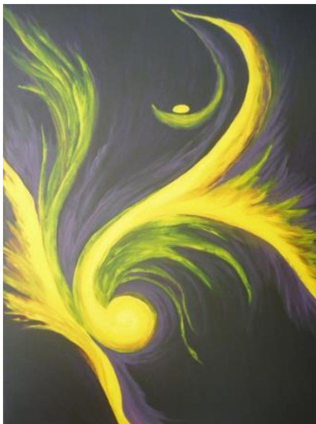
„Gelber Vogel IV“, 2012 Acryl auf Leinwand 70x100 cm