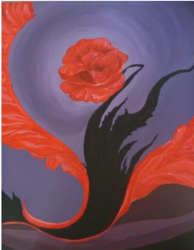
„Feuerblüte“, 2013 Acryl auf Leinwand 70x100 cm