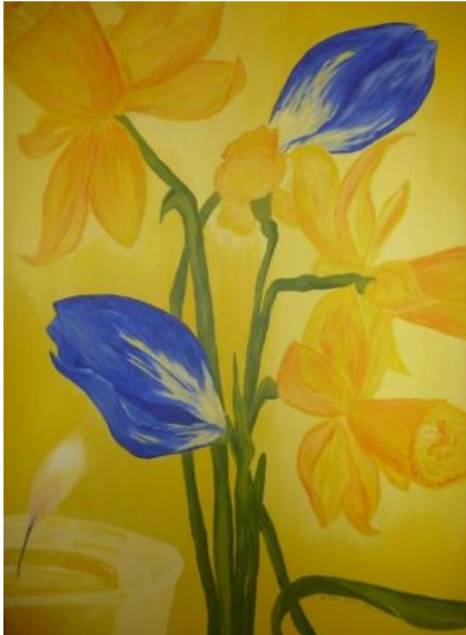
„Blaue Tulpen“, 2013 Acryl auf Leinwand 70x100 cm