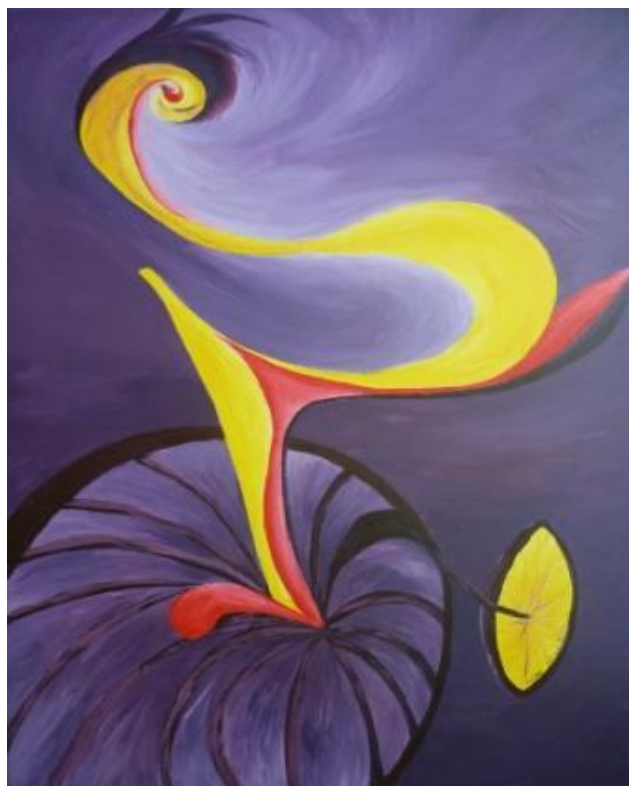
„Radler“, 2016 Acryl auf Leinwand 60x80 cm