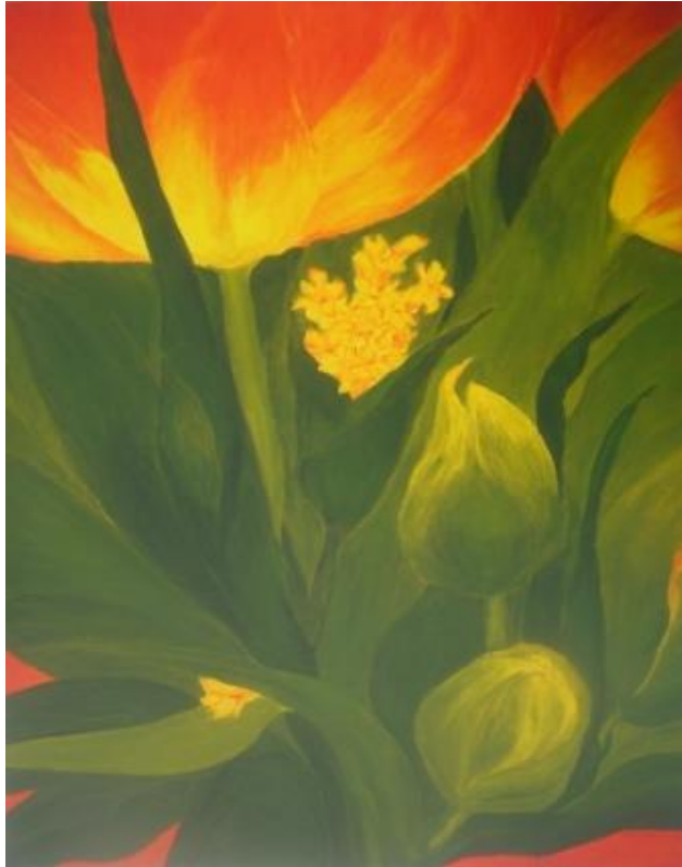
„Rote Tulpen“, 2012 Acryl auf Leinwand 60x80 cm