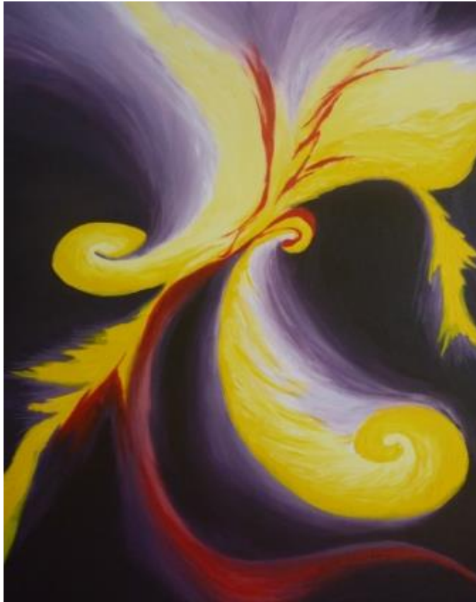
„Blume II“, 2014 Acryl auf Leinwand 60x80 cm