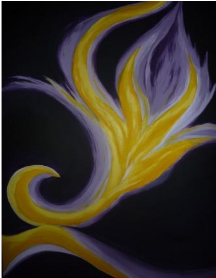
„Lebensblüte“, 2017 Acryl auf Leinwand 100x150 cm