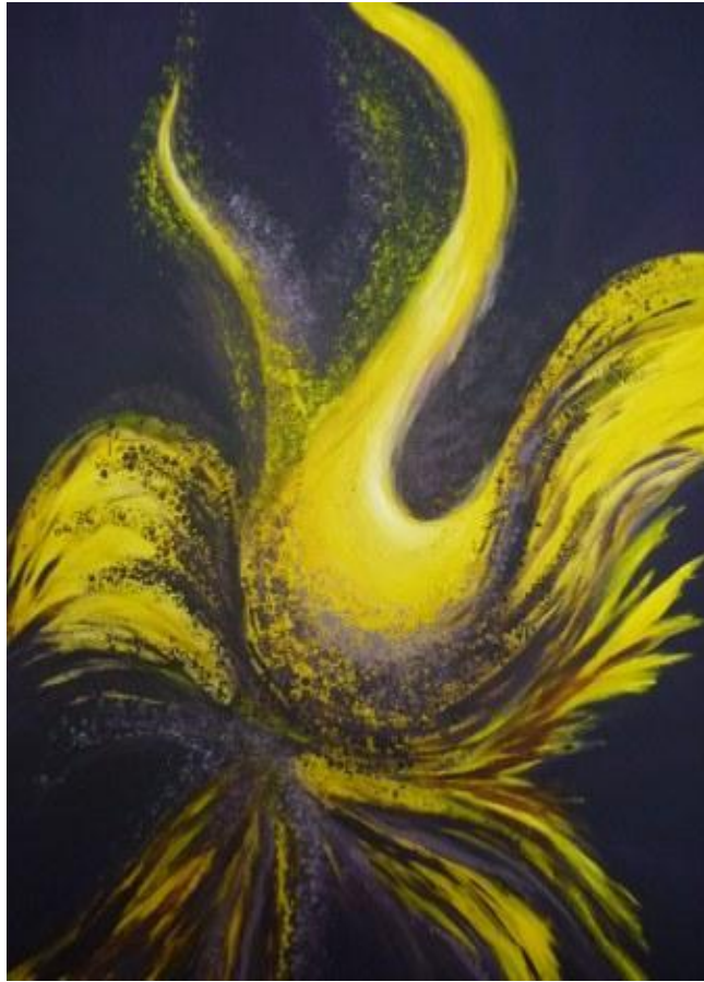
„Vogel VII“, 2017 Acryl auf Leinwand 90x150 cm