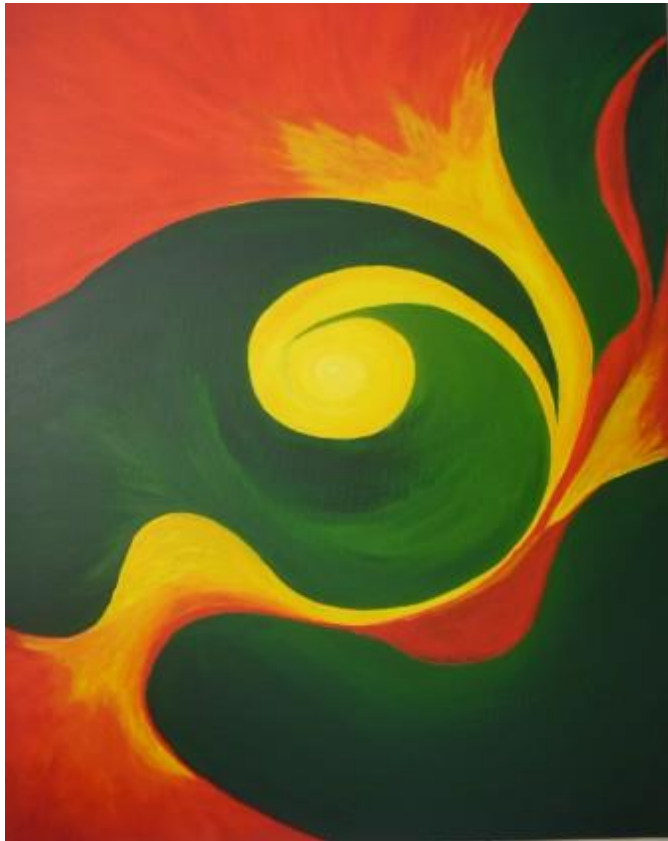
„Rote Tulpen abstrakt“, 2012 Acryl auf Leinwand 60x80 cm