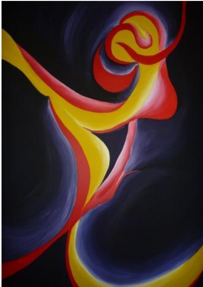
„Orchidee“, 2017 Acryl auf Leinwand 90x150 cm