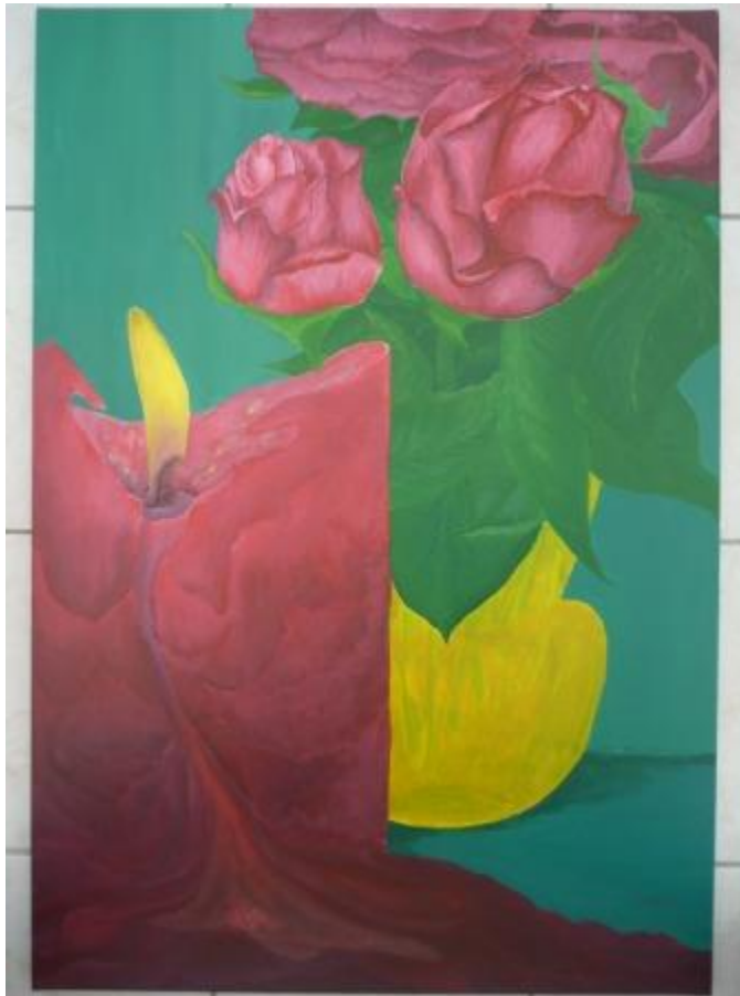
„Rote Rosen“, 2012 Acryl auf Leinwand 70x100 cm