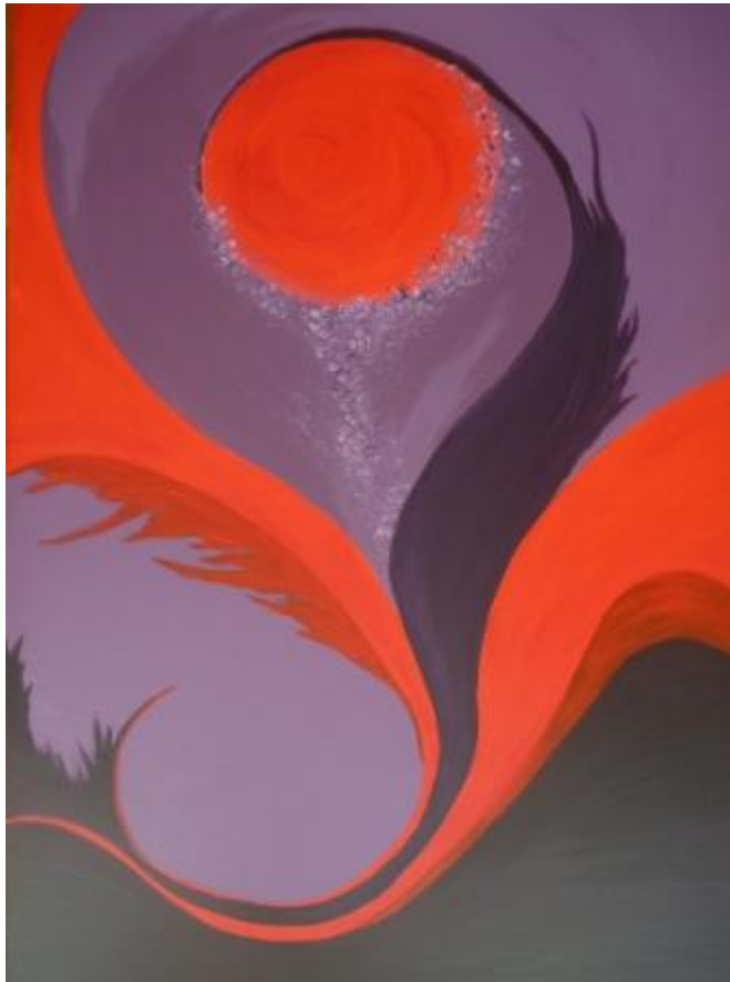
„Feuerball“, 2012 Acryl auf Leinwand 70x100 cm