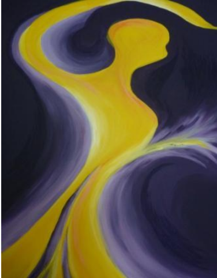
„Federkleid“, 2017 Acryl auf Leinwand 100x150 cm