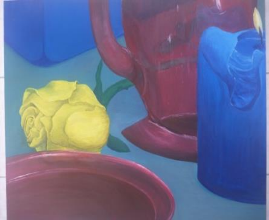
„Gelbe Rose“, 2008 Acryl auf Leinwand 91x73 cm