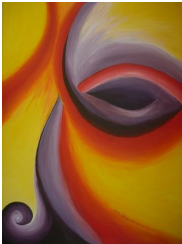
„Blick“, 2013 Acryl auf Leinwand 60x80 cm