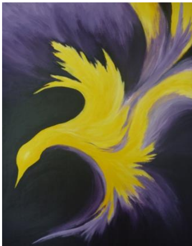
„Gelber Vogel V“, 2012 Acryl auf Leinwand 60x80 cm